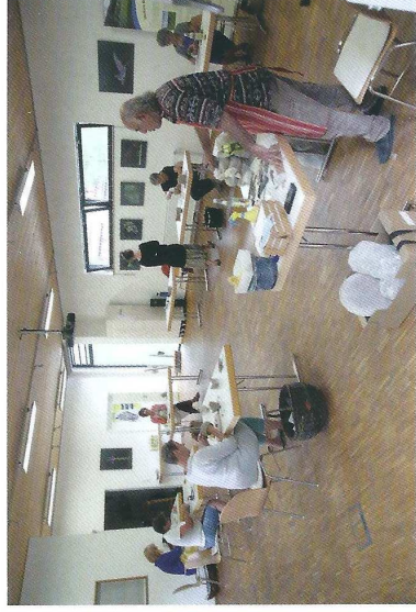
Raku-Kurs im Haus der Natur Beuron

Unsere Vorstellung von Gesellschaft ist, dass alle zusammengehören, egal welcher Herkunft sie sind. So wie Goethe in seinem Werk „West-Östlicher Divan“ schreibt: